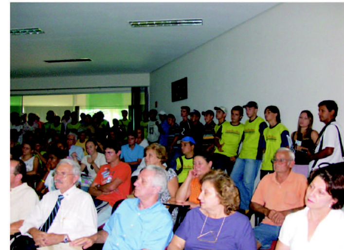
Autoridades e convidados presentes na 1ª Oficina Prática do Projeto, realizada no dia 20/02/2008.