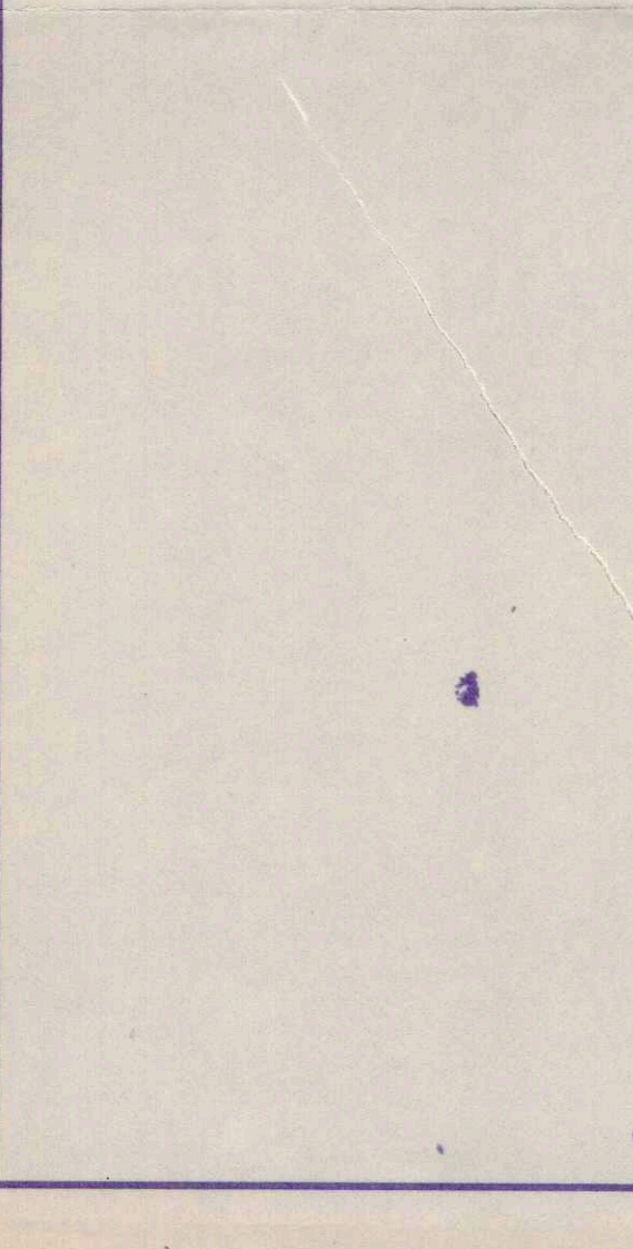
DETALHE GENCIO DAS CURVAS NAS ESQUINAS Esc.: 1:250